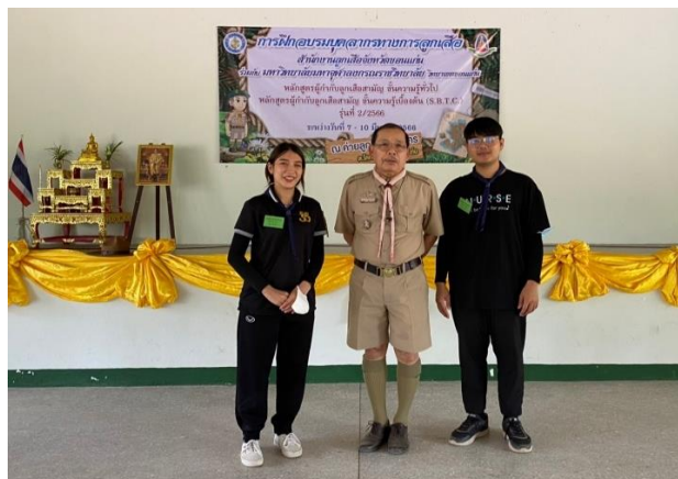
อบรมผู้กำกับลูกเสือ