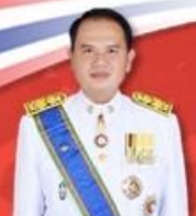
ดร.อารยันต์ แสงนิกุล พ.สพ.ขอนแก่น เขต1