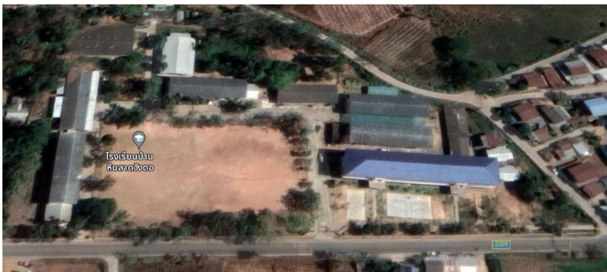
พื้นที่โรงเรียนบ้านหินลาดวังตอ